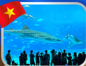
The Sea Shell Aquarium