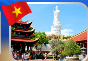
พระโพธิสัตว์กวนอิม วัดโหลว๊ก