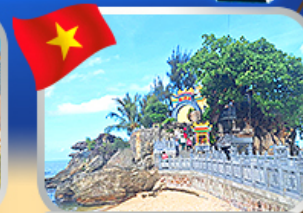
อัคราเรขอพราสาทเจ้าฉิ่งเกา