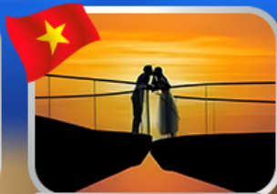
ชมอาทิตย์ตก ณ สะพานงู