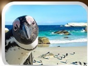
Simon's Town ชมนกเพนกวินสุดน่ารัก