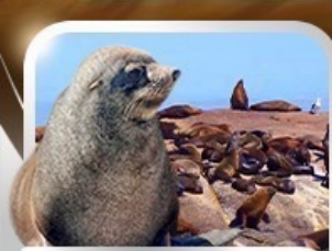
ล่องเรือชมฝูงแมวน้ำ ru Seal Island

ทะเลทรายซาฟารี อุทยานสัตว์ป่าหุบเขาพิลานเนเบิร์ก