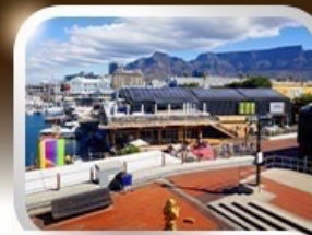
ช้อปปิ้งท่าเรือแบรนด์ชั้นนำ V&A waterfront