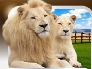
เข้าชมสวนเสือแบงโกลิซิด The Lion Park