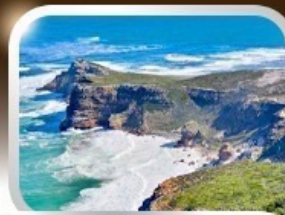
ชมวิวยามเย็นสุดแอฟริกา cape of good hope