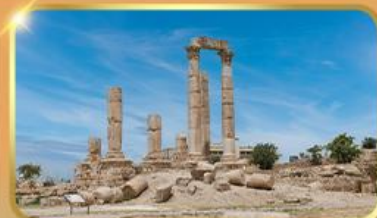
ปิอัมปราการอันนา

โอวัลพลาซ่า • มหานคร เพตรา • อคาบา • ทะเลทรายวาดีรัม • ซิตี้บอลล์ • ซุ้มประตูกษัตริย์ฮอเดเรียน • โบสถ์กรีก-อโธด็อกซ์แห่งเซนต์จอร์จ