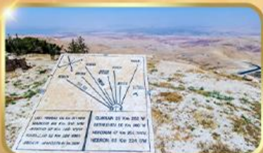
ยอดเขาเมาร์เนโบ