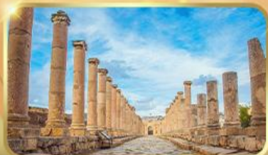
เมืองโบราณราช