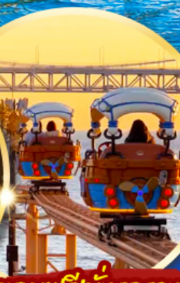
แถมฟรีนั่งรถราง