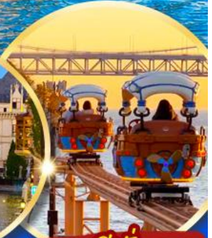
แถมฟรี! นั่งรถราง