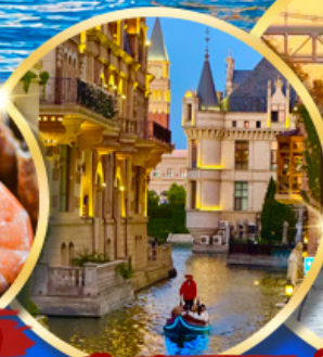
เมืองน้ำเวนิส