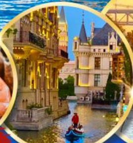
เมืองน้ำเวนิส