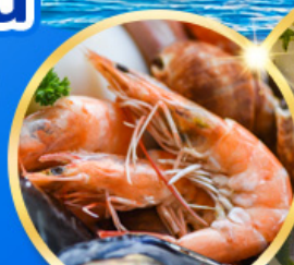
อาหารซีฟู้ด