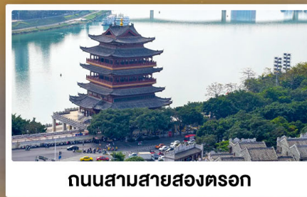
ถนนสามสายสองตอรอก