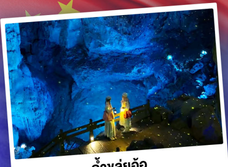
ถ้ำลู่อ้อ

"ดินแดนแห่งสาขน้ำและภูเขา" สัมผัสประสบการณ์นั่งบอลลูนชมวิวมุมสูง