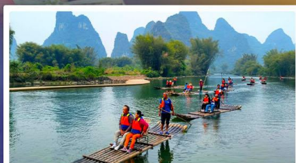
ล่องแพไม้ไผ่ห้วยหลง