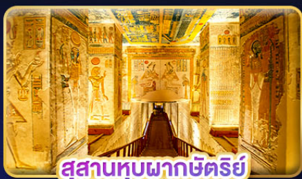
สุสานทูปพากซ์ตรีรี่