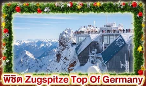
พีชิต Zugspitze Top Of Germany

สัมผัสที่สุดแห่ง CHRISTMAS MARKET 2026 เทศกาลแห่งความสุขที่สุดแห่งปี