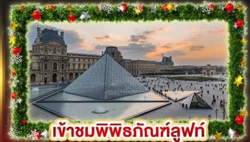
เจ้าชมพิพิธภัณฑ์ลูฟร์