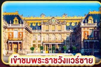
เข้าชมพระราชวังแวร์ซาย