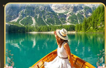
พายเรือทะเลสาบ Braies