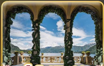
เชคอิน Villa del Balbianello

ที่สุดของธรรมชาติแห่งอิตาลี ทิวเขา ทะเลสาบ ความงามแห่งโดโลไมท์