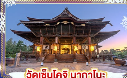
วัดเซ็นโคจิ นากาโนะ