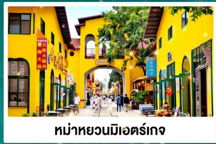
หมู่บ้านมิตร์เกจ