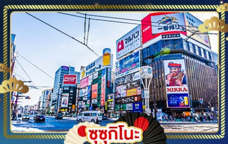
ซูซุกิโนะ