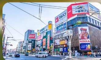
ซูซุกิโนะ