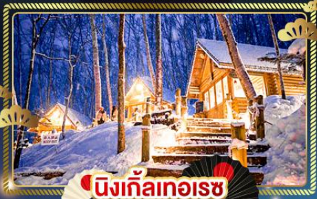
นิงเกิ้ลทอริช