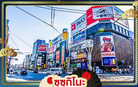
ซูซุกิโนะ