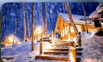
นิงเกิ้ลเทอเรส