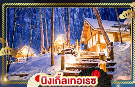
นิงเกิ้ลทอเรซ