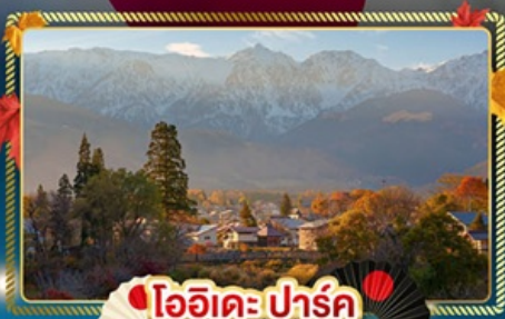
ไอฮิเดะปาร์ค