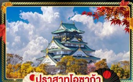
🍁 ปราสาทโอซาก้า