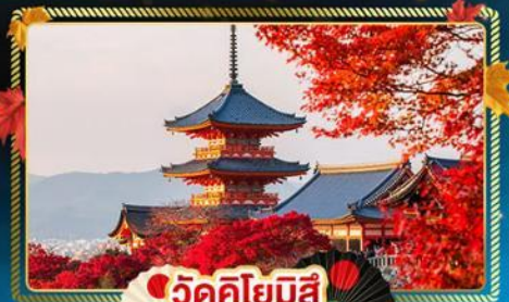
🍁 วัดคิโยมิจิ