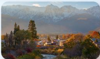
โออิเดะ ปาร์ค