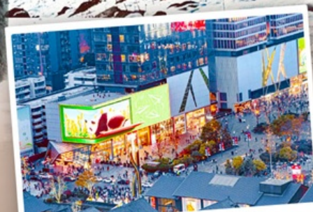
ถนนไท่กู๋หลี่หลิน