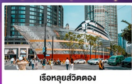
เรือทลุยส์วิตตอง