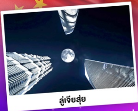
ดูเจียสู่ย