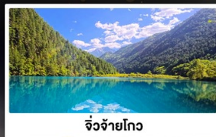
จิ้งจ้ายโกว