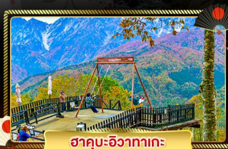
ฮาคุบะฮิวาตากะ