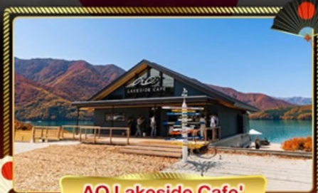
AO Lakeside Cafe'