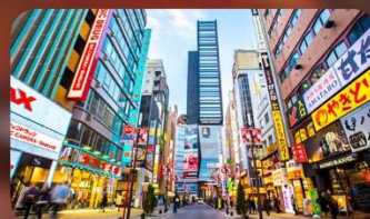
ซ้อปบั้งชินจูกุ