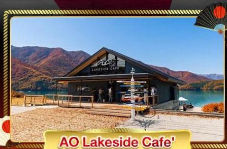
AO Lakeside Cafe'