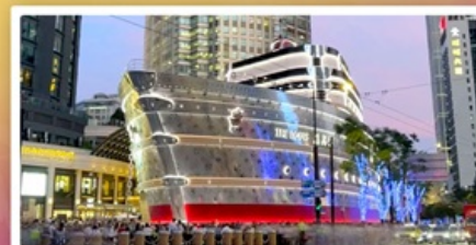
เรือทูลย์สวีตตอง