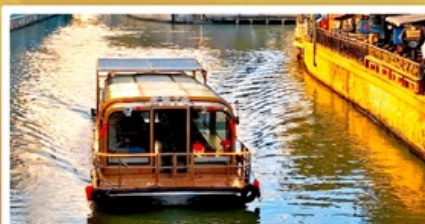
ล่องเรือ Grand Canal