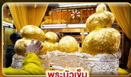
พระบิวเข้ม