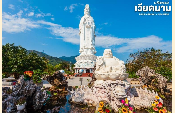
เบสิกทริปปี้ เวียดนาม ดานัง • ฮอยอัน • บานาฮิลล์

สักการะ วัดลินห์อิง (Linh Ung) เป็นวัดที่ใหญ่ที่สุดของเมืองดานังภายในวิหารใหญ่ของวัดเป็นสถานที่บูชาเจ้าแม่กวนอิมและเทพองค์ต่างๆตามความเชื่อของชาวบ้านแถบนี้ นอกจากนี้ยังมีรูปปั้นปูนขาวเจ้าแม่กวนอิมซึ่งมีความสูงถึง 67 เมตรตั้งอยู่บนฐานดอกบัวกว้าง 35 เมตรยื่นหันหลังให้ภูเขาและหันหน้าออกทะเลคอยปกป้องคุ้มครองชาวประมงที่ออกไปหาปลา นอกชายฝั่งวัดแห่งนี้นอกจากเป็นสถานที่ศักดิ์สิทธิ์ที่ชาวบ้านมากราบไหว้บูชาและขอพรแล้วยังเป็นอีกหนึ่งสถานที่ท่องเที่ยวที่สวยงามเป็นอีกหนึ่งจุดชมวิวที่สวยงามของเมืองดานัง และแวะให้ท่านเลือกชมและซื้อของฝากเป็นที่ระลึกที่ ร้านเยื่อไผ่