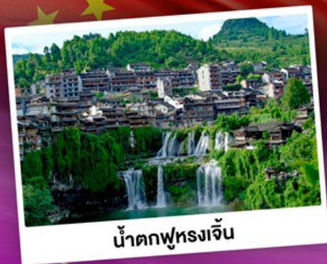
น้ำตกฟูหลงเจิ่น