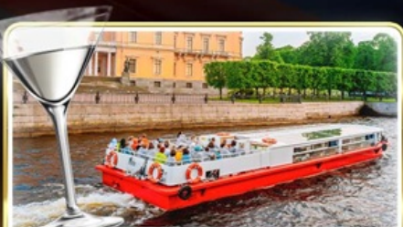
ส่องเรือแม่น้ำเนวา พร้อมเสิร์ฟ Vodka Tasting