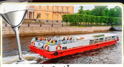
ส่องเรือแม่น้ำแคว พร้อมเสิร์ฟ Vodka Tasting