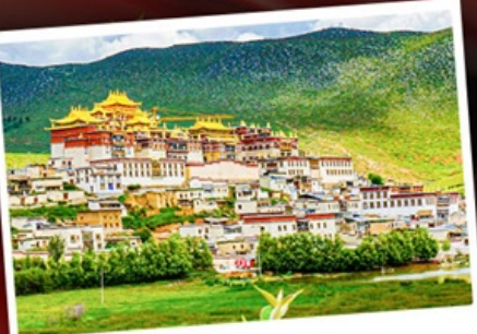
วัดชงจั้นหลิน