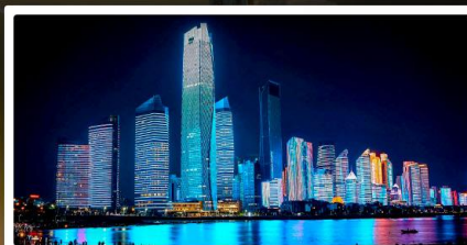
หาดไซเบอร์ฟิงก์