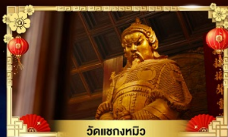
วัดแซกทมิฬ