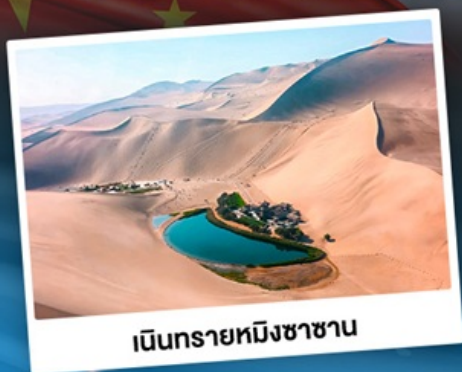
เนินทรายหึงซาซาน