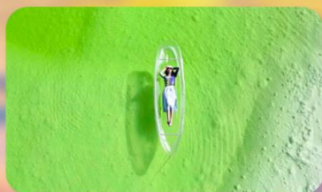
ทะเลสาบเกลือดาเอ๋อร์ฮั่น