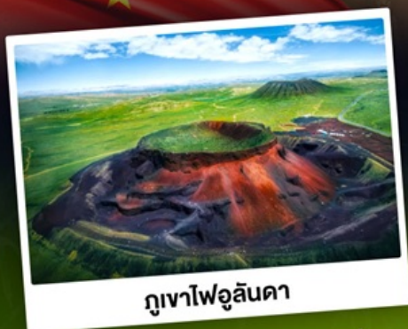
ภูเขาไฟอูลันดา

ท่องเที่ยวแดนแห่งทะเลทรายและทุ่งหญ้า ชมพระอาทิตย์ขึ้นทุ่งหญ้าออร์ดอส