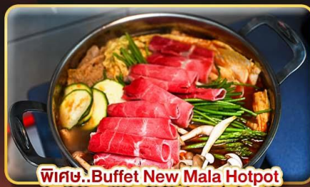
พิเศษ..Buffet New Mala Hotpot Free Flow Beer & Soft Drink