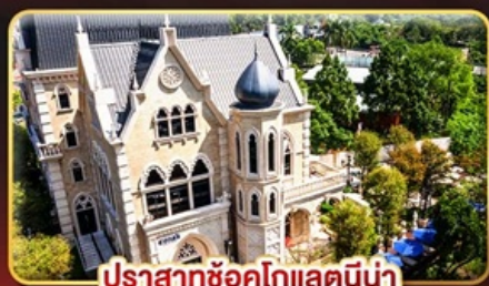
ปราสาทซ็อคโกแลตนี้่น่า