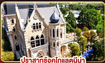
ปราสาทซอกโกแลตนี้่น่า

มรดกแห่งเมืองสี่พันแควไทเป ช้อปปิ้งใจ..ตลาดซีเหมินติง ตลาดโจง