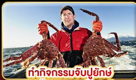
ทำกิจกรรมจับปูยักษ์ “พร้อมเมนูสุดพิเศษ”