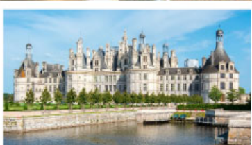
เข้าชมพระราชวังซ็องบอร์