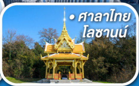
• ศาลาไทย โลซานน์

• สุดอากาศดีดีที่ซอร์แมก • ขึ้นกระเช้าสู่ยอดจากกลาเซียร์ 3000 • ชมเมืองคลาสสิกเบิร์น ลูเซิร์น ซูริก