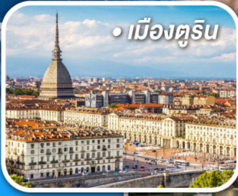
• เมืองตูริน