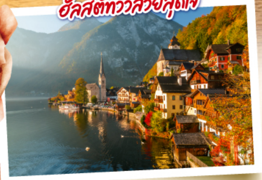
อัลสตัดท์ที่สวยงาม