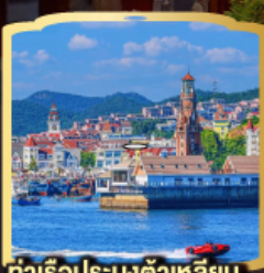
ท่าเรือประมงต้าเหลียน