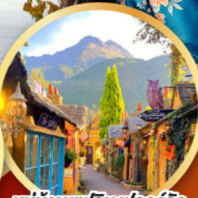
หมู่บ้านยูฟูอิน ฟลอร์ริล