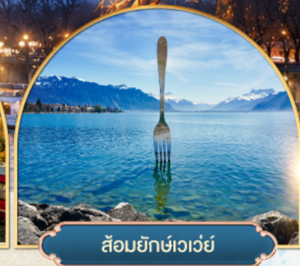
ล้อมยักซ์เวอว์