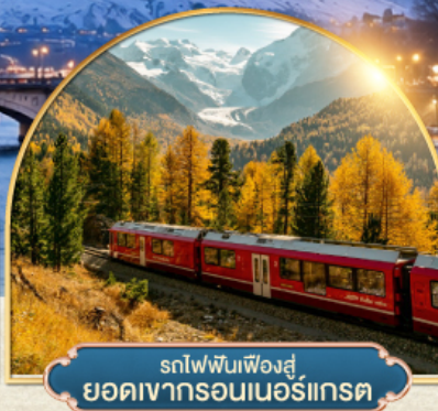
รถไฟพินเฟองส์ ยอดเขากรอนเนอร์เกรต