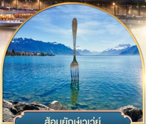
ล้อมยักเขาวัว