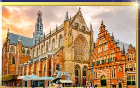
จัตุรัสเมืองฮาร์เล็ม

พรมแดนเมืองเปลาเกเนเธอร์แลนด์และเบลเยียม เดินเมืองเคลฟท์ เมืองเครื่องปั้นดินเผาระดับโลก ฮาร์เล็มเมืองมั่งคั่งที่สุดของเนเธอร์แลนด์