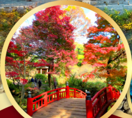
สวนดอกบ๊วยอาตามิ