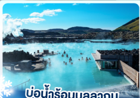
♨️ แช่น้ำร้อนบลูลากูน

เก็บไอซ์แลนด์ แดนภูเขาไฟคิร์กจูเฟล และ แช่น้ำร้อนบลูลากูน