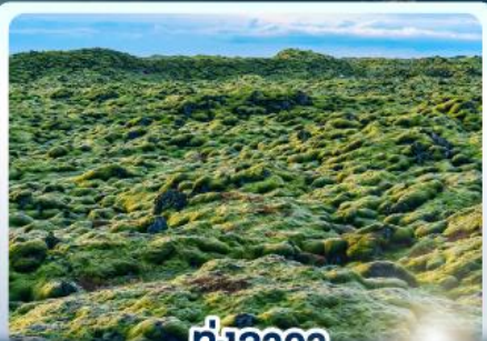
ทุ่งลาวา