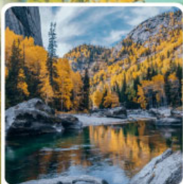
เคนเคอทิวให้อัจฉริยะภูพานิน