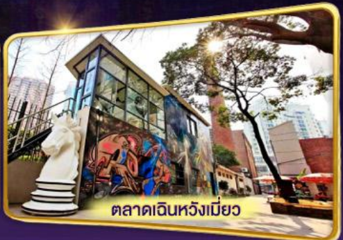
ตลาดเดินหวังเมี่ยว