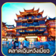
ตลาดฉินหวงเมี่ยว