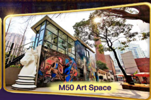
M50 Art Space