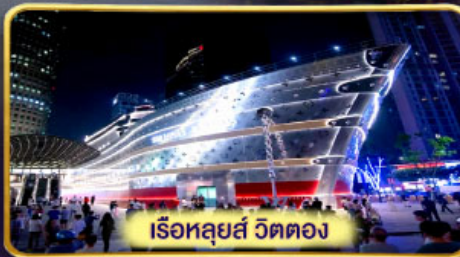
เรือหลุยส์ วิตตอง