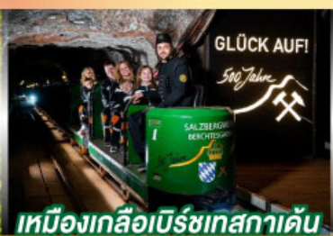
เหมืองเกลือเบิร์ชเทสกาเดิน