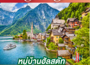
หมู่บ้านอัลสติก