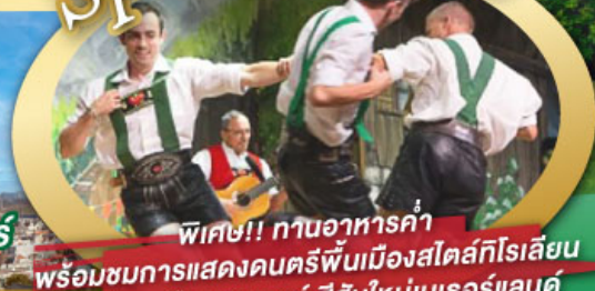
พิเศษ!! ทานอาหารค่ำ พร้อมชมการแสดงดนตรีพื้นเมืองสไตล์โรเลียน และเยือนเมืองอูเทรคต์ สีสันใหม่เนเธอร์แลนด์

ไฮไลท์ในโปรแกรม • เยือนเมืองแห่งแคว้นบาวาเรีย และ ทิโรล • สุกสนานเหมืองเกลือเบิร์ชเทสกาเดิน • เข้าชมปราสาทนอยชวานสไตน์ • เดินเล่นจัตุรัสโรเมอร์ ซอปปิง Zeil Street • ถ่ายรูปมุมสวยของหมู่บ้านอัลสติก • ซิลลา ไปในเมืองซาลสบูร์ก บ้านเกิดโมซาร์ท 25 ก.ย. - 04 ต.ค. 69 • ล่องเรือหมู่บ้านทีธูร์น และ ล่องเรือชมนครอัมสเตอร์ดัม 09-18, 16-25 ต.ค. 69 • ซอปปิงจุ้ย่านดิมสแควร์และเดินเล่นย่านโคมแดง 22-31 ต.ค. 69 / 06-15 พ.ย. 69 29 ธ.ค. 69 - 07 ม.ค. 70 * ปีใหม่ *