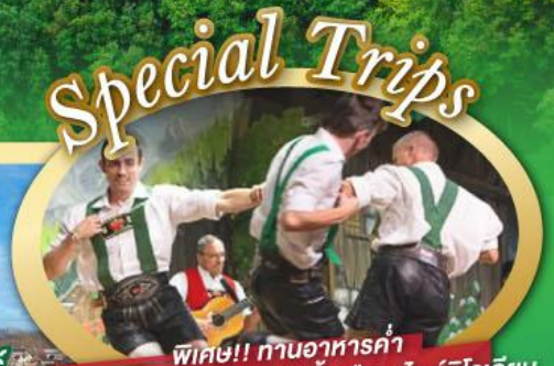
พิเศษ!! ทานอาหารค่ำ พร้อมชมการแสดงดนตรีพื้นเมืองสไตล์ทิโรเลียน และเยือนเมืองอูเทรคต์ สีสันใหม่เนเธอร์แลนด์