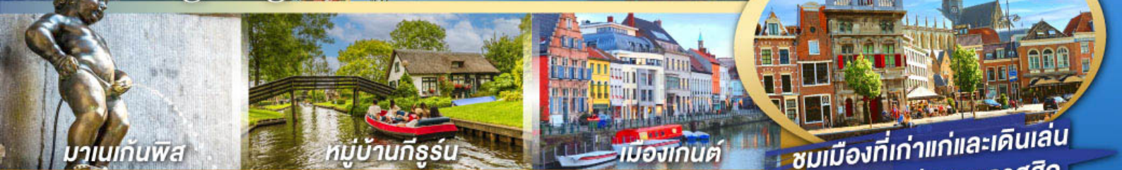
มานเนกันพิส