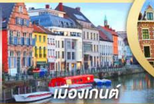
เมืองกันต์