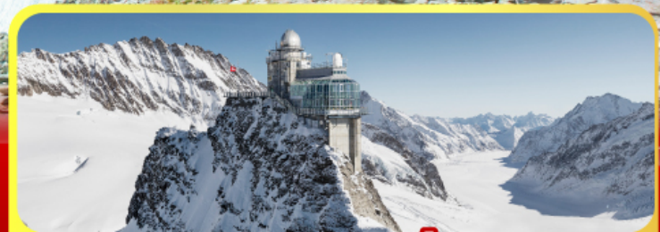
ยอดเทาจุงเฟรา