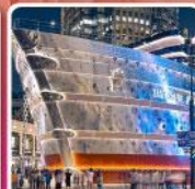
เรือหลุยส์