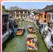
หมู่บ้านโบราณซูเจียเจี๋ย