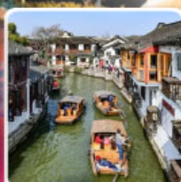
หมู่บ้านโบราณจูเจียเจียว