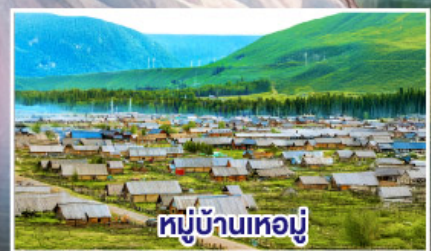
หมู่บ้านเหมอู๋