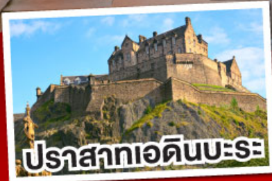
ปราสาทเอดินเบระ