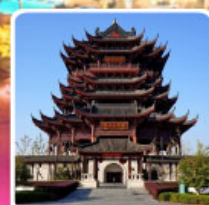
วัดหลงหยวน