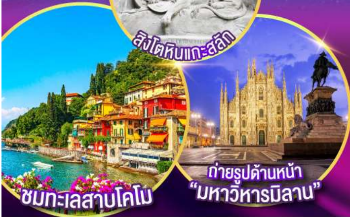
ชมทะเลสาบโคโม