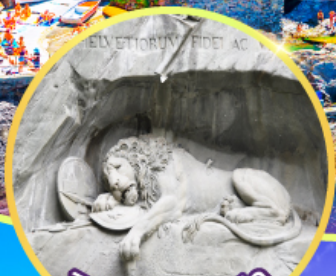
สิงโตหีบกระสลัก