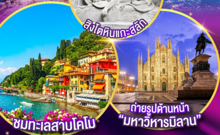
ถ่ายรูปด้านหน้า "มหาวิหารมิลาน"