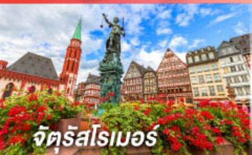
จัตุรัสโรมอน