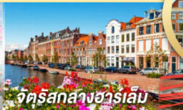
จัตุรัสกลางฮาร์เล็ม