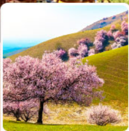
ทุ่งดอกอัลมอนต์